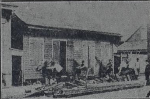
CASA CONSTRUIDA A RAS DE TIERRA SE HALLA infestadísima de ratas. Elevada a una altura de 45 centímetros, dejó de servir de madriguera a los roedores peligrosos