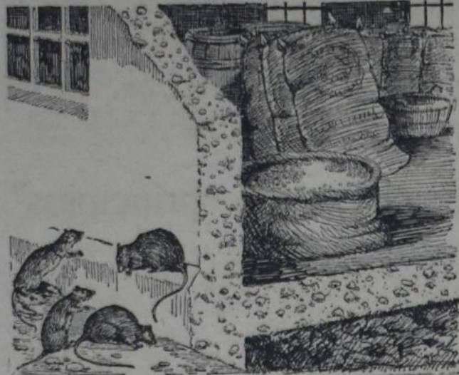
CONSTRUCCION A PRUEBA DE RATAS.

En estos días en que la comprobación de dos casos de bubónica en Santa Fe ha puesto de moda la desratización, medida profiláctica de una ineficacia absoluta si no se la practica de una manera seria y permanente, es muy oportuno hablar de lo que